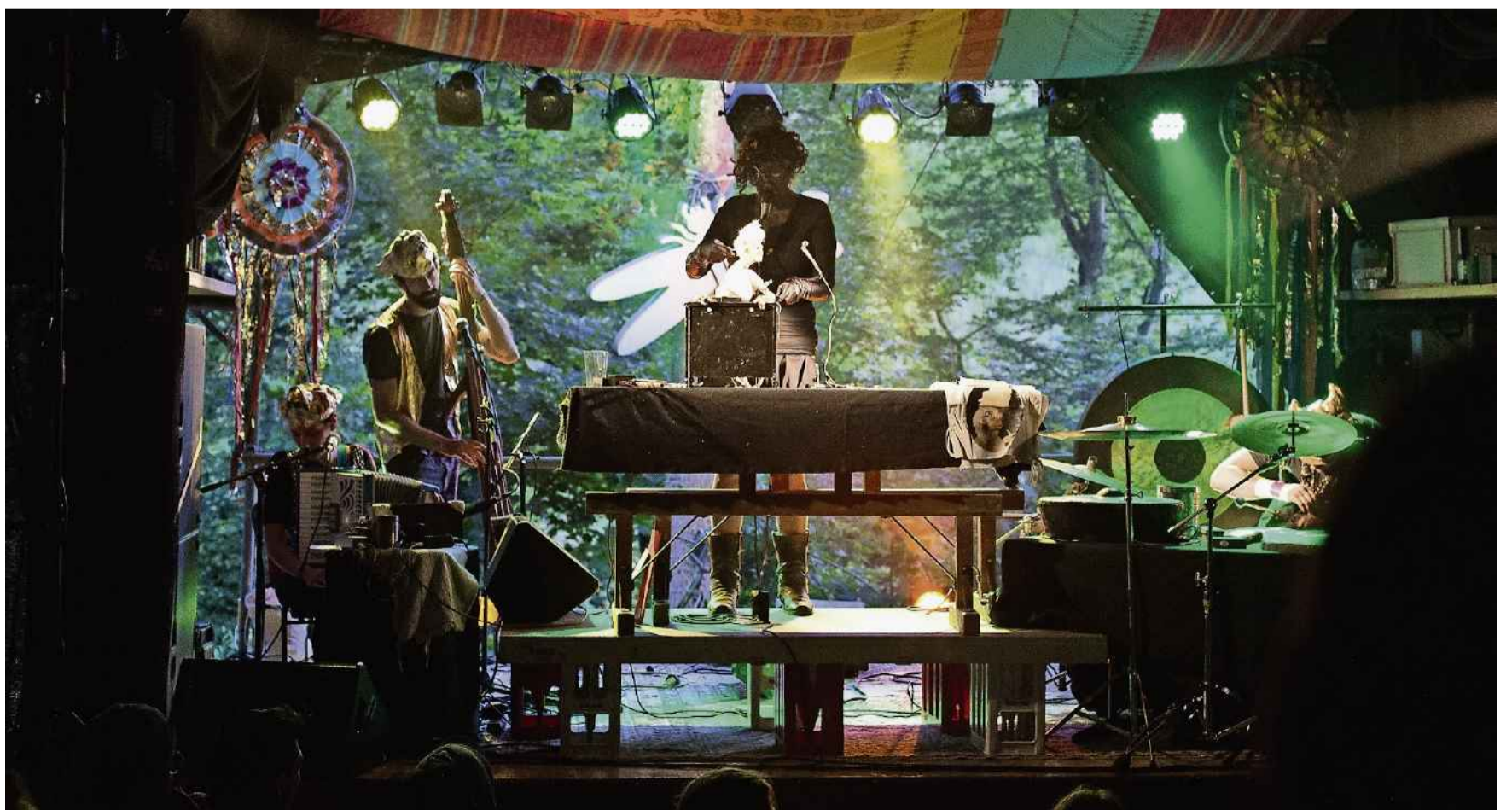
Das Festival des Arcs in Ehrendingen ist idyllisch gelegen. Mit Kunst und Licht unterstreichen die Organisatorinnen diese Stimmung.

Wir verlosen 2x1 Festivalpass für das Festival des Arcs in Ehrendingen am 21., 22. und 23. Juni. E-Mail an wettbewerb@aargauerzeitung.ch bis Donnerstag, 13 Uhr mit dem Betreff «Kultur Ehrendingen» und Ihrer Telefonnummer. Nur wer telefonisch erreichbar ist, hat Anspruch auf Gewinn.