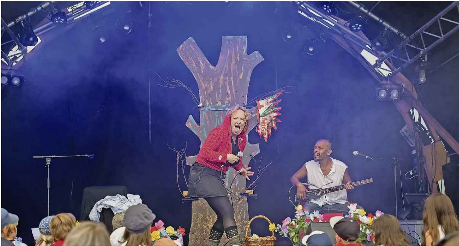
Auch dieses Jahr findet der traditionelle «Advent im Kurtheater» wegen Umbauarbeiten nicht im Kurtheater selbst statt.