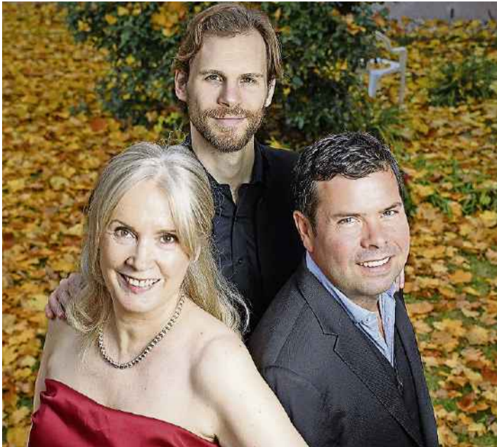
Das Trio White Raven singt im Rahmen von «Voce'19» Open Air bei der Alten Mühle in Otelfingen.

«Grill und Bier» Bei jedem Wetter. 11.00–16.00: Bierbrauerei Kündig