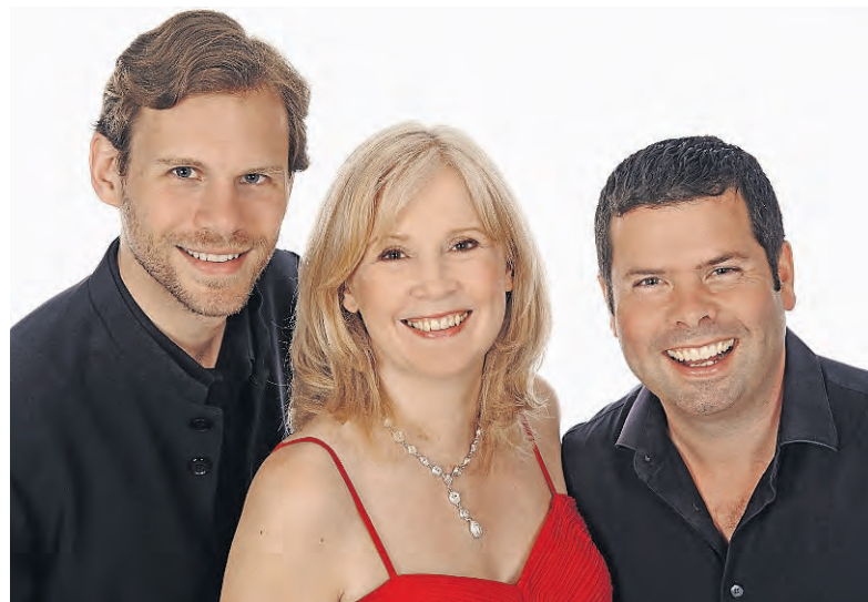
Die Band White Raven spielt am Open Air in Otelfingen.

Am Freitag, 21. Juni, jeweils um 20 Uhr finden in privaten Räumlichkeiten der drei Gemeinden sogenannte Stubete statt. Die Gast-