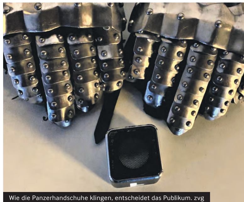
Wie die Panzerhandschuhe klingen, entscheidet das Publikum.

«Mauern bauen hilft nicht gegen Töne», sagt er und schmunzelt wegen seiner politischen Anspielung. Er hält es lieber mit den Santalis, einem Volk aus dem Himalaja-Gebirge, die er besucht hatte: «Wenn der Murmelstrom fließt, weht der Honigwind.» Von Corinne Rufli